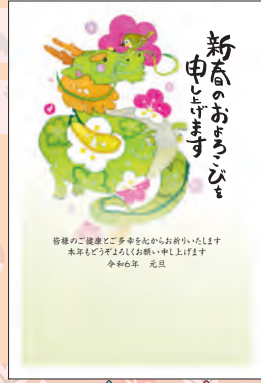
NO.423 ビジネス用 一般用