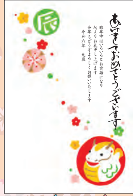
NO.432 ビジネス用 一般用