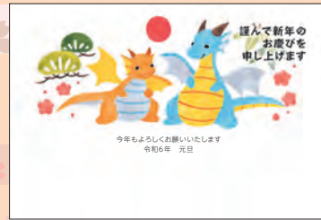
NO.438 ビジネス用 一般用