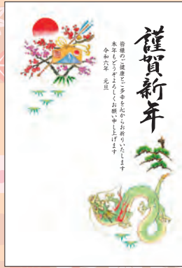
NO.425 ビジネス用 一般用