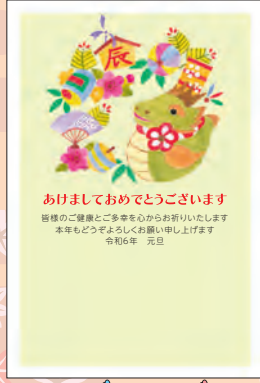
NO.431 ビジネス用 一般用