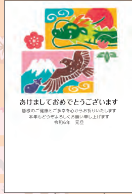
NO.429 ビジネス用 一般用