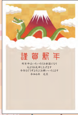
NO.422 ビジネス用 一般用