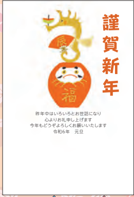
NO.421 ビジネス用 一般用