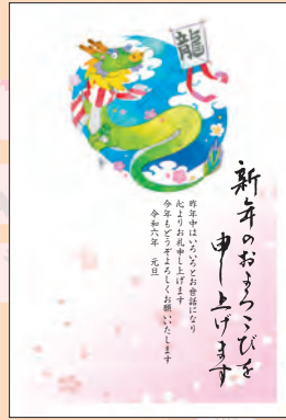
NO.426 ビジネス用 一般用