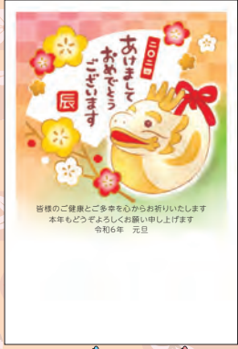
NO.430 ビジネス用 一般用