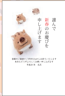
No.423 ビジネス用 一般用