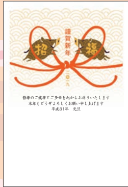
No.422 ビジネス用 一般用