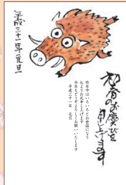
No.432 ビジネス用 一般用