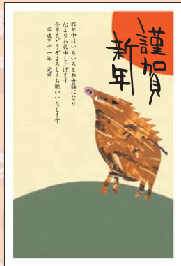
No.430 ビジネス用 一般用