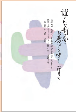
NO.426 ビジネス用 一般用