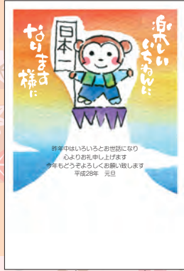
NO.428 ビジネス用 一般用