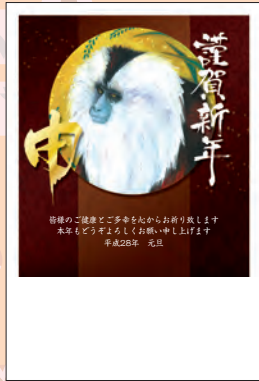
NO.423 ビジネス用 一般用