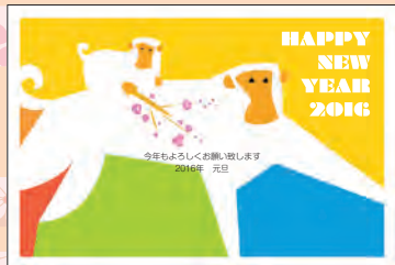
NO.436 ビジネス用 一般用