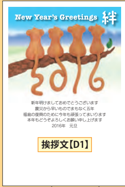
NO.434 ビジネス用 一般用