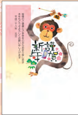
NO.425 ビジネス用 一般用