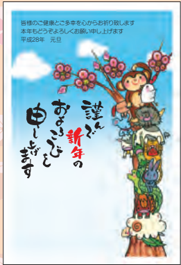
NO.421 ビジネス用 一般用