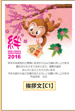
NO.433 ビジネス用 一般用