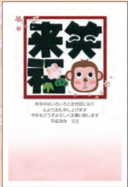
NO.430 ビジネス用 一般用