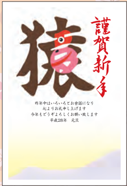
NO.424 ビジネス用 一般用